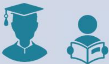
Студент - воспитанник

Комментарии со стороны взрослого иногда ранят ребёнка. Часто проявляются психологические барьеры.