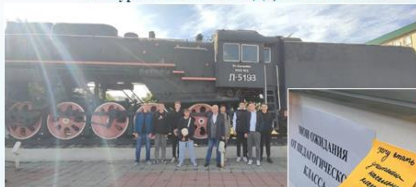
Экскурсии на ОАО «РЖД», АО «Тяжмаш»