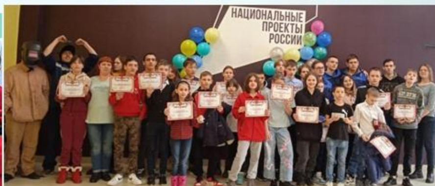
Квест-игра «Профессии вокруг меня»