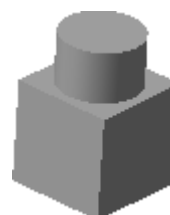
Рис. 2 Неудачное положение модели.

Рекомендуемую ориентацию довольно трудно получить, если вращать модель мышью (с помощью средней кнопки или команды «Повернуть»), но совсем легко, если воспользоваться клавиатурными комбинациями. Общий порядок работы при этом следующий.